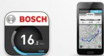
Application Bosch pour smartphones eBike Connect

Nyon n'est pas seulement une petite merveille de la technologie parfaitement ergonomique, agréable au toucher, très esthétique, et qu'on a plaisir à utiliser. C'est aussi un ordinateur intelligent qui vous donne accès à tout ce dont vous avez besoin sur votre vélo électrique : navigation, assistance au pédalage, informations sur l'autonomie, indicateurs de forme physique, et bien d'autres choses encore. Nyon les réalise en réseau avec l'application pour smartphone eBike Connect et le portail eBike-Connect.com .