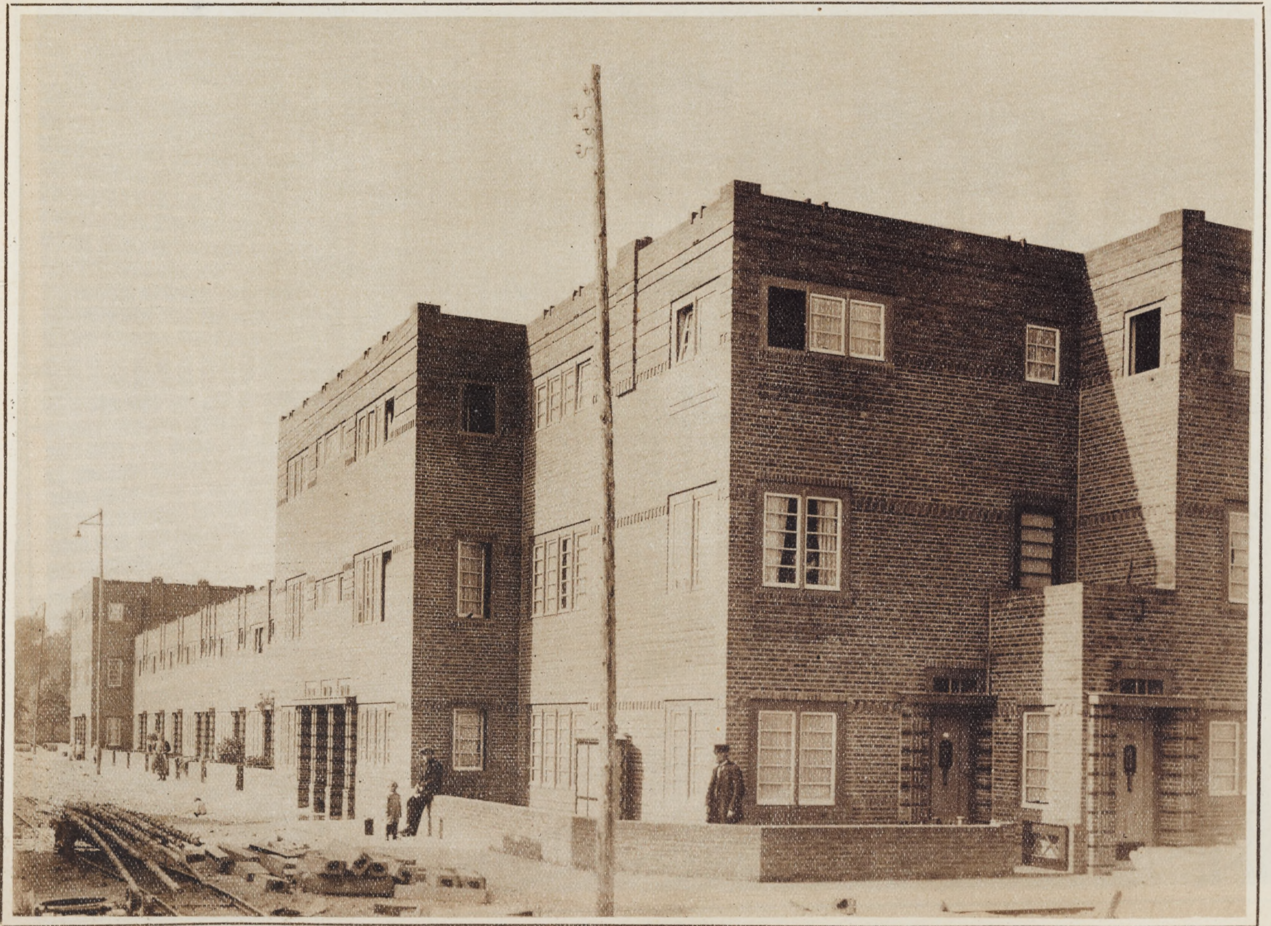
Complexe d'habitations ouvrières à Bois-le-Duc (Hollande)