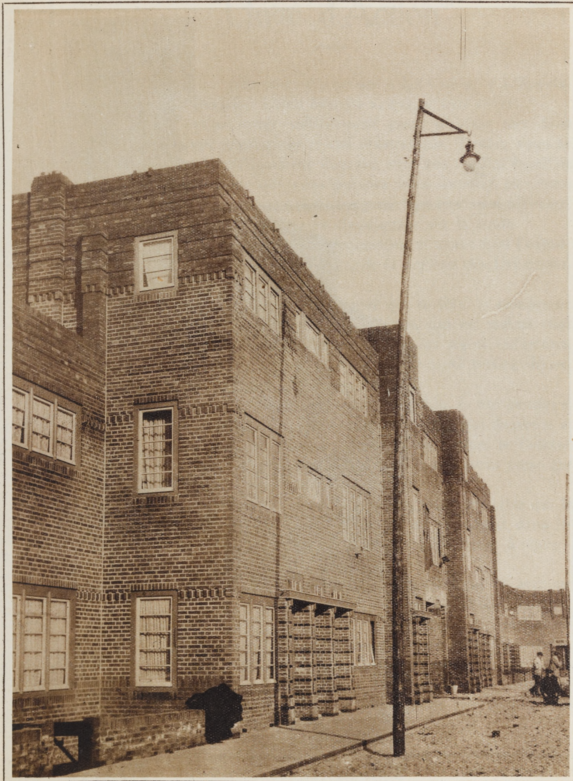
Complexe d'habitations ouvrières à Bois-le Duc (Hollande)