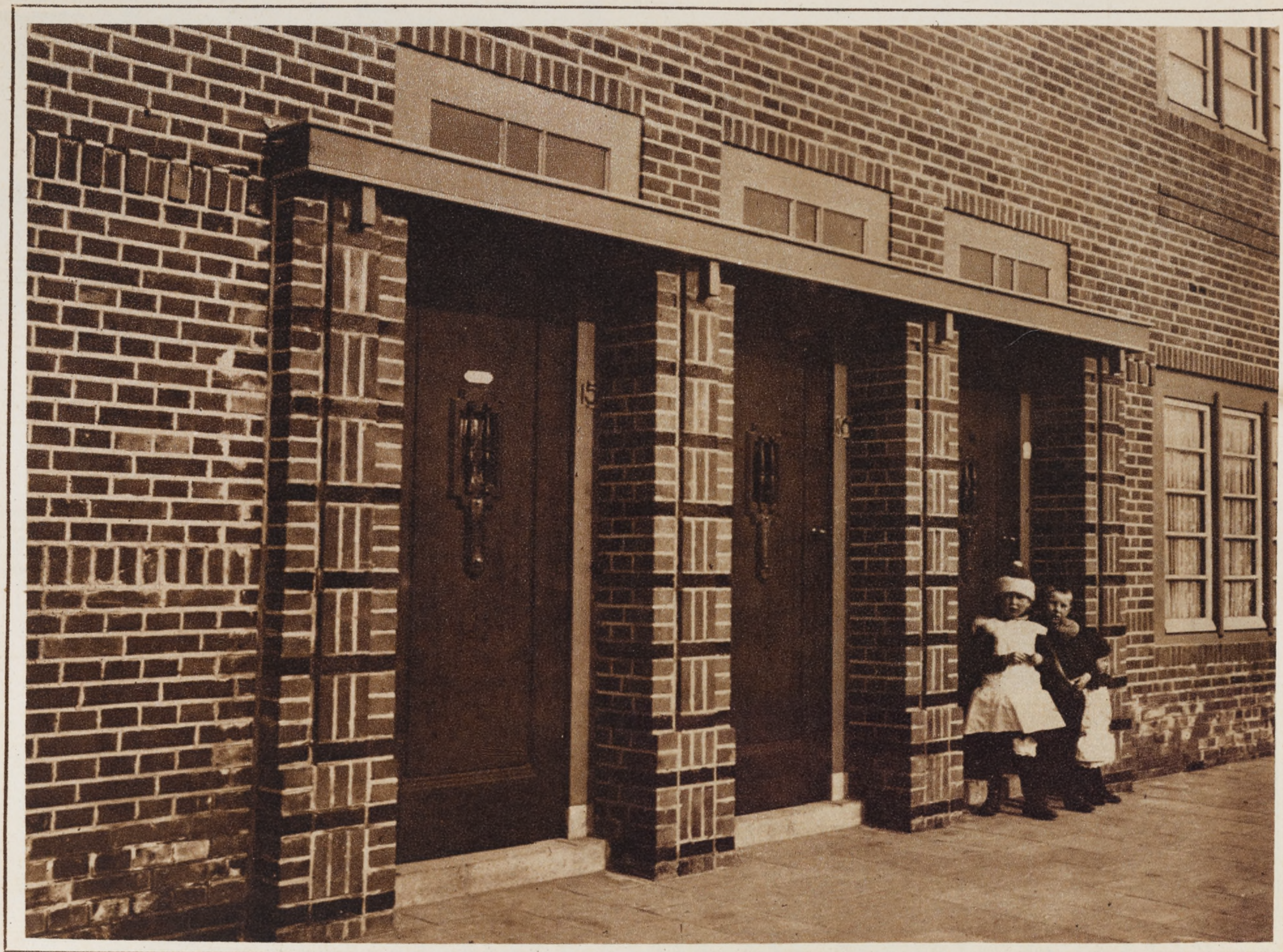
Complexe d'habitations ouvrières à Bois-le-Duc (Hollande)

Hendrik Willem VALK Architecte B. N. A. Bois-le-Duc