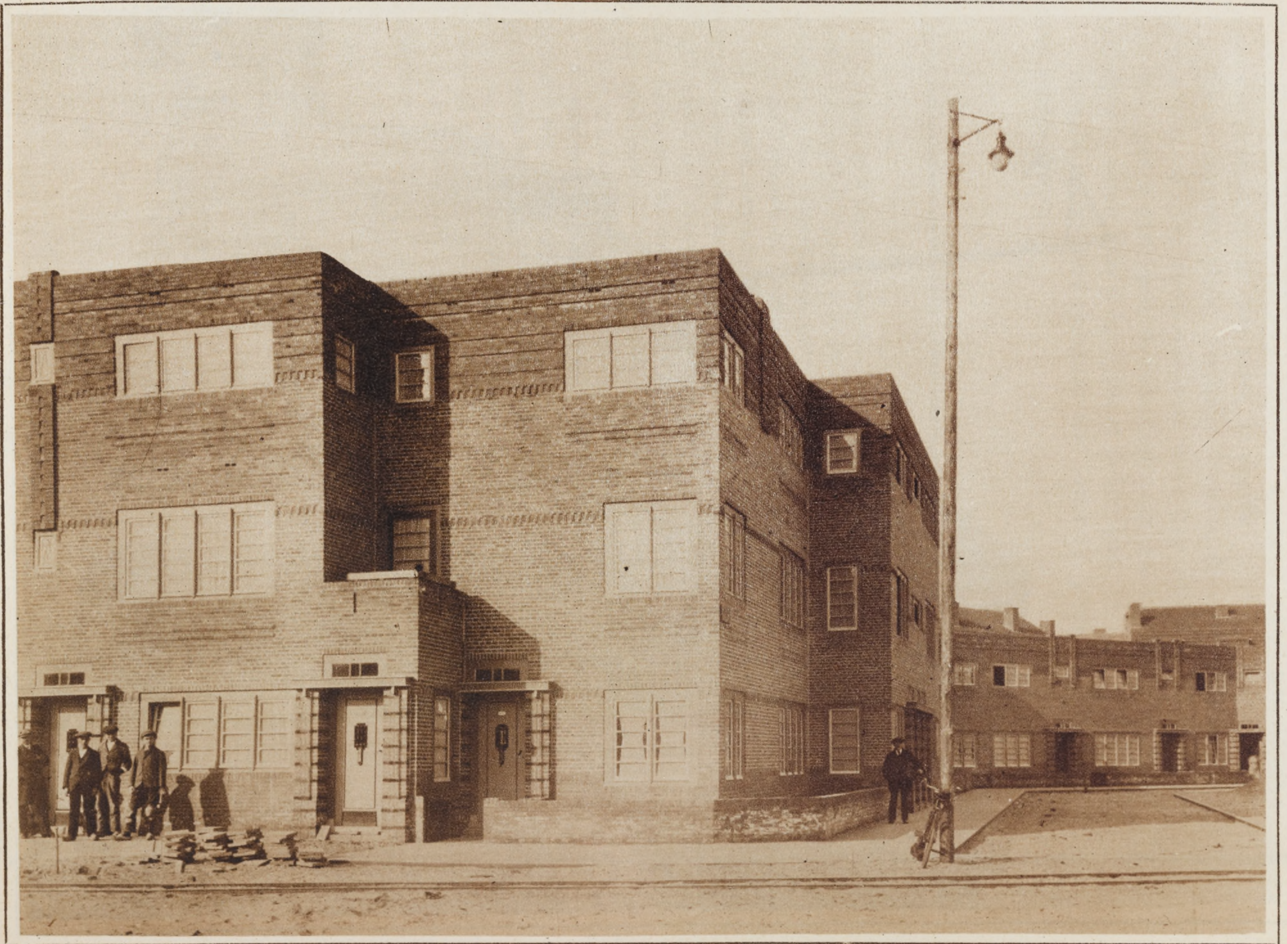
Complexe d'habitations ouvrières à Bois-le-Duc (Hollande)