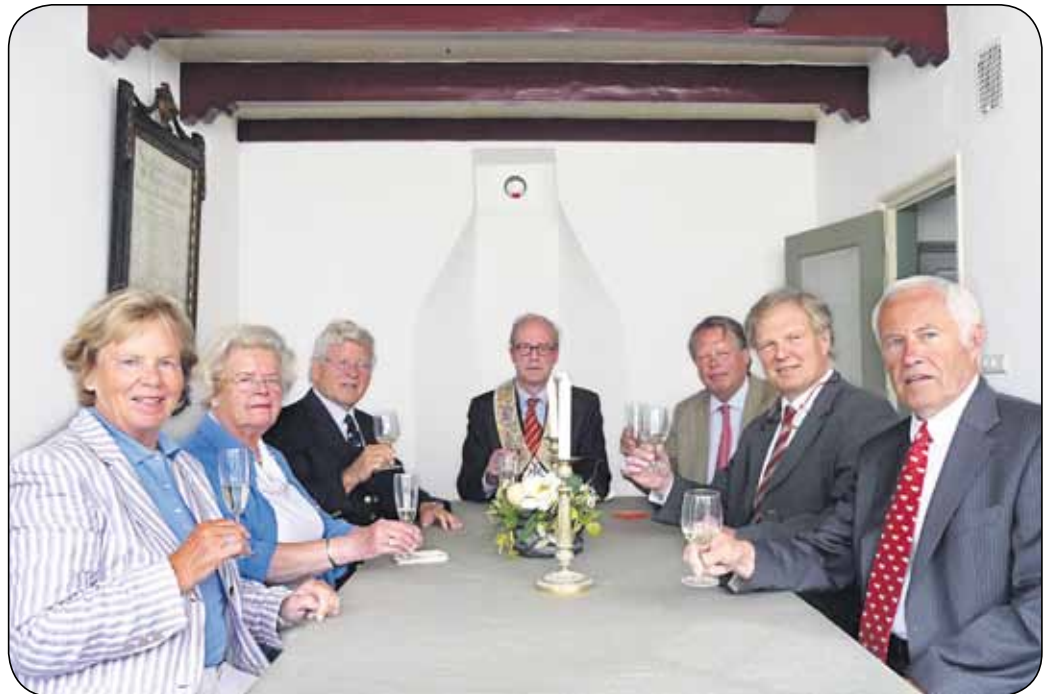
• De besturen van het Burgerweeshuis, het Heilige Kerstmisgilde en De Bakenesserkamer bijeen in de gerestaureerde regentenkamer

Ongeveer even oud is stichting Burgerweeshuis, dat voortkwam uit het Heilige Geesthuis (1394) en later haar zorg naar wezen verlegde. Voordat het glas in de, met geld van Ymere en het Burgerweeshuis gerestaureerde, regentenkamer