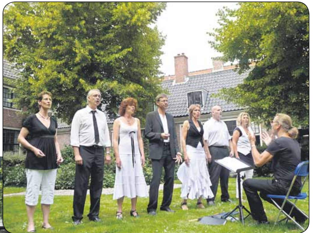
• Dubbelkwartet Cigale in Proveniershof