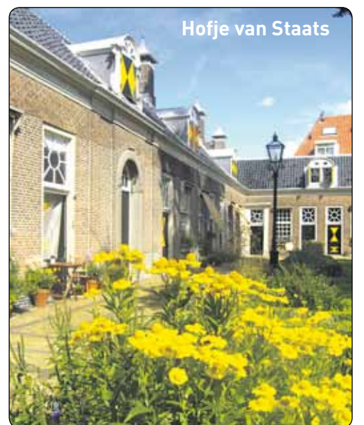
Hofje van Staats

dienst voor Archeologie, Cultuurlandschap en Monumenten en het Ministerie van OCW.