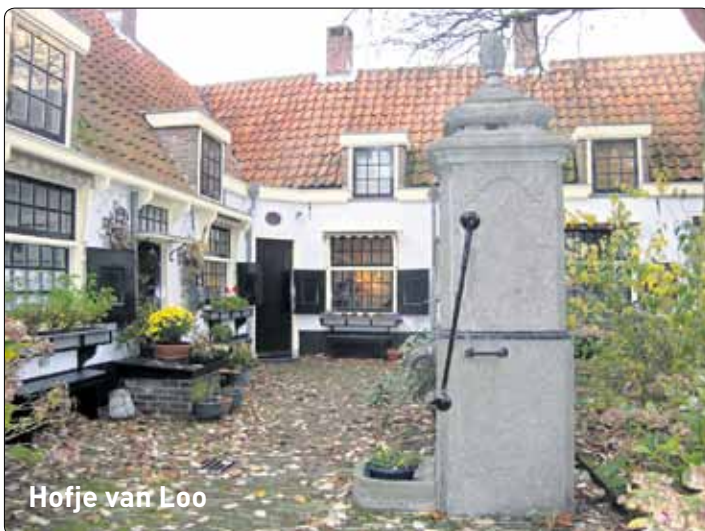
Hofje van Loo

monumenten. „De bewoners moeten er wel fijn kunnen blijven wonen, zonder overlast van het bezoek. De kwestie van extra onderhoud om een erkenning te behouden zal zeker een aandachtspunt zijn,” meent De Lange. Hij benadrukt dat de erkenning uiteraard moet worden besproken met het Landelijk Hofjesberaad, de Rijks-