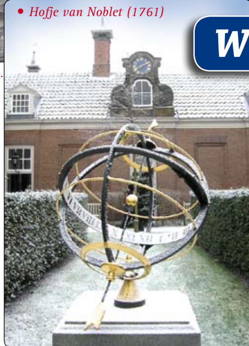
• Hofje van Noblet (1761)