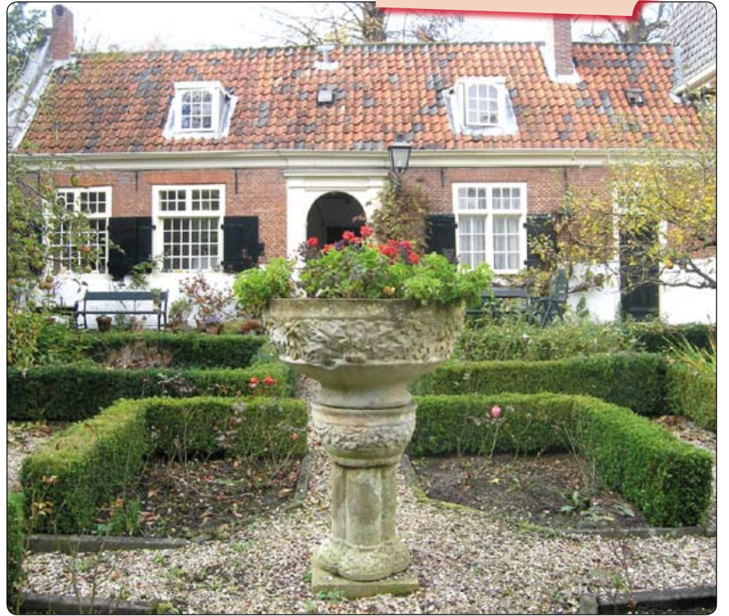
• Hofje van Heythuyzen

De saamhorigheid leek als het ware in de intieme bouw besloten te liggen. Maar onder de formele oppervlakte broeide natuurlijk altijd de wereld van alledag. De samenleving verandert, hofjes zijn gebleven én worden aangepast aan de eisen van deze tijd. Dit papieren initiatief volgt ook die veranderingen, vat samen en maakt zich sterk voor behoud van een uniek woonfenomeen. Eén van de bindende factoren in het hofjesleven is de opzichter(es) of beheerder die namens een regentenbestuur of de woningbouwvereniging de bewoners ondersteunt in woonvragen. Hoewel de hofjesbewoner steeds jonger wordt, is de trend dat de alleenwonende burger zo lang mogelijk zelfstandig blijft. Dat kan alleen als naast woonzorg ook zaken als thuiszorg en gezondheidszorg goed geregeld zijn. Om die reden kan de ruimte die hiervoor in de krant beschikbaar is ook als voorbeeld dienen voor woon- en thuiszorg elders. Want wie weet gaat de gezamenlijke inspanning wel verder dan het eigen hofje! Kortom, leven in de hofjesbrouwerij.