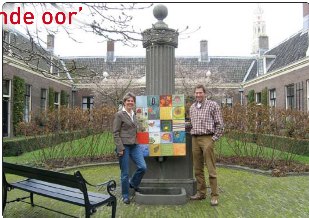
• Met het afscheidscadeau van twintig bewoonsters in de hof tuin