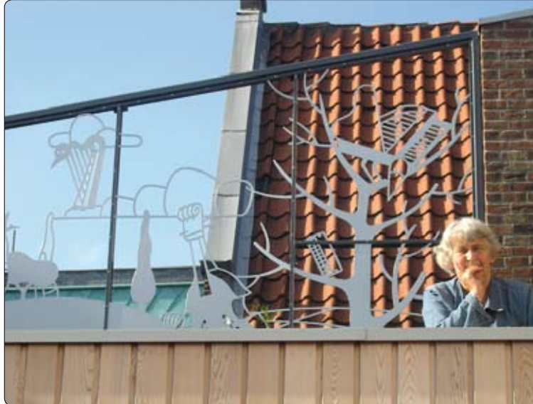
• Een bewoonster geniet van de hofrust