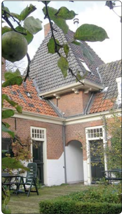
• Hofje van Heythuyzen

• Je zou die behoefte met een beetje goede wil hofjesgeest kunnen noemen. Hofjes zijn historisch gezien bijzondere woonplekken waar tradities en gewoontes eeuwenlang de boventoon voerden.