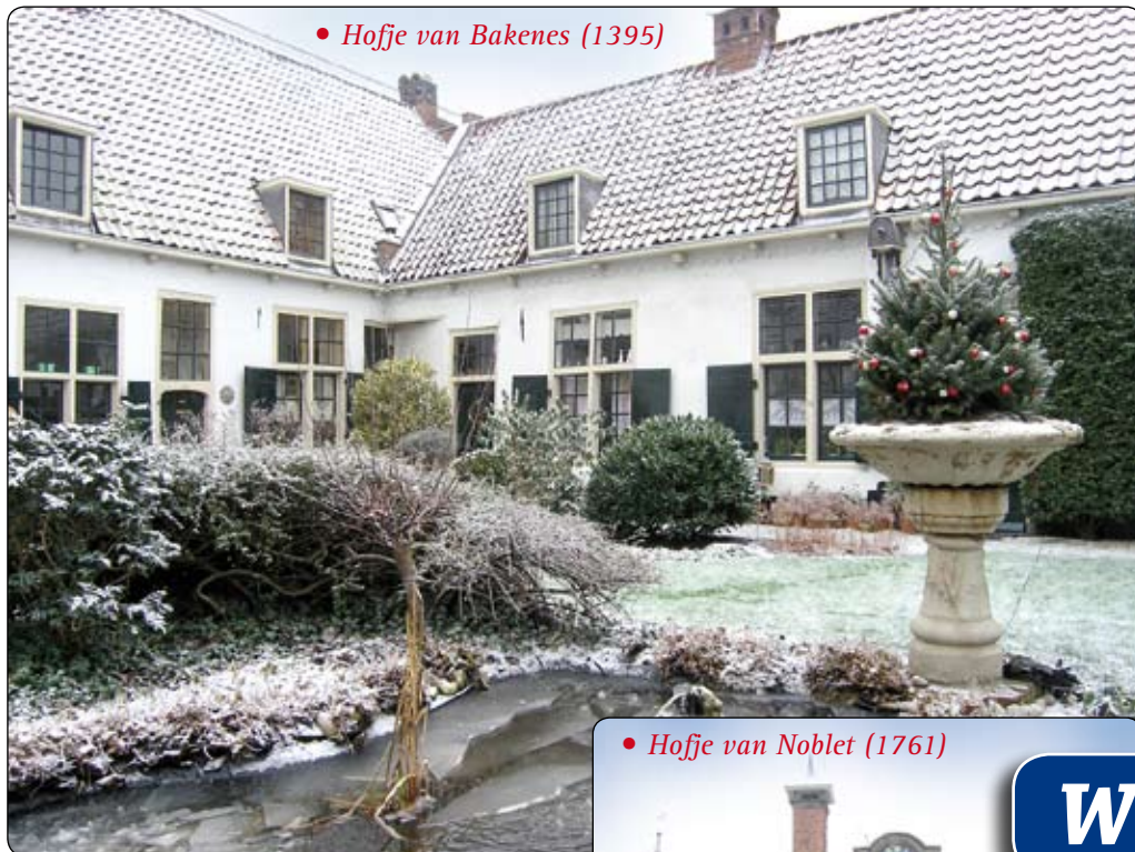
• Hofje van Bakenes (1395)