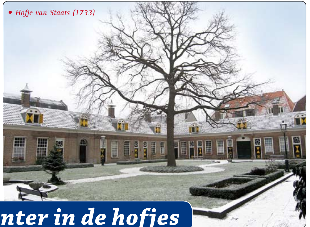
• Hofje van Staats (1733)