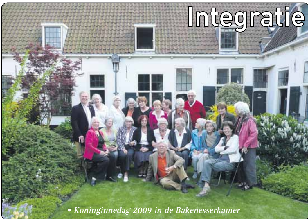
• Koninginnedag 2009 in de Bakenesserkamer