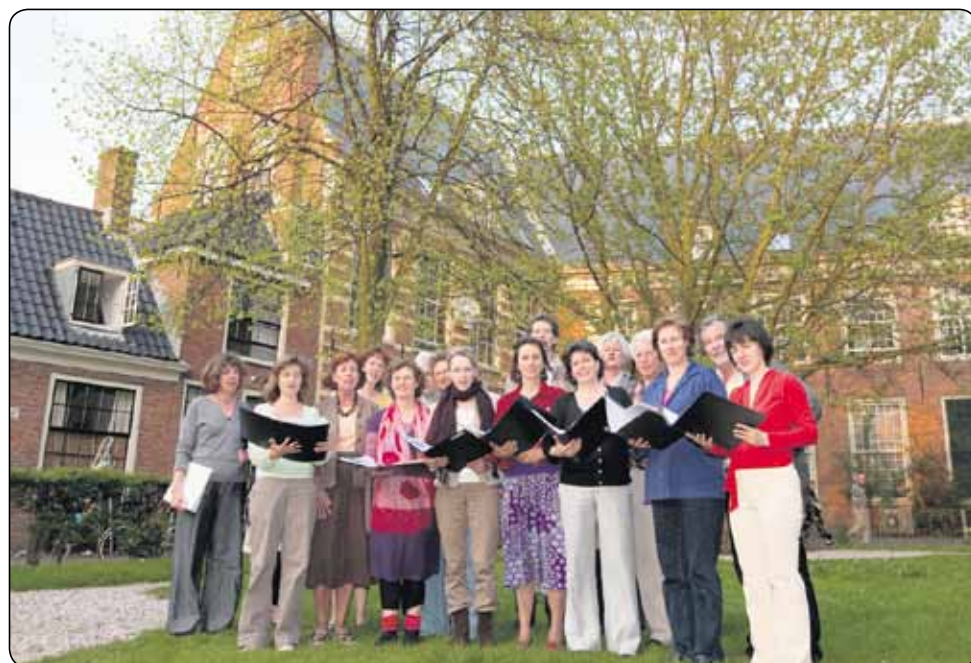
• Arte Vocale oefent in het Proveniershof

Naast muziek uit eigen repertoire brengen de vijf koren volksmuziek uit de Scandinavische en Baltische landen. De uitvoeringen vormen een kring door de stad: elk ensemble verzorgt een optreden van een half uur en verhuist dan naar het volgende hofje. Per hofje is er een gastvrouw of