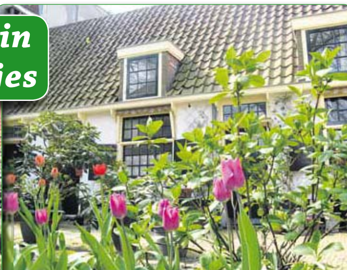
• HOFJE VAN LOO