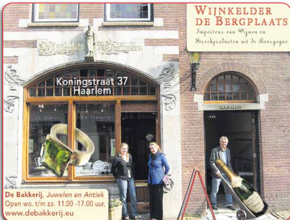
De Bakkerij, Juwelen en Antiek Open wo. t/m za. 11.00 - 17.00 uur, www.debakkerij.eu