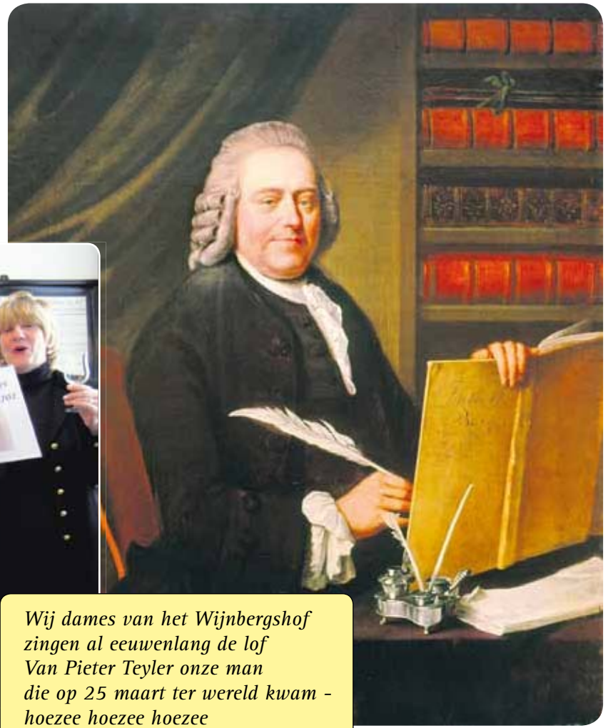
Wij dames van het Wijnbergshof zingen al eeuwenlang de lof Van Pieter Teyler onze man die op 25 maart ter wereld kwam - hoezee hoezee hoezee (tekst: E. van der Lek)