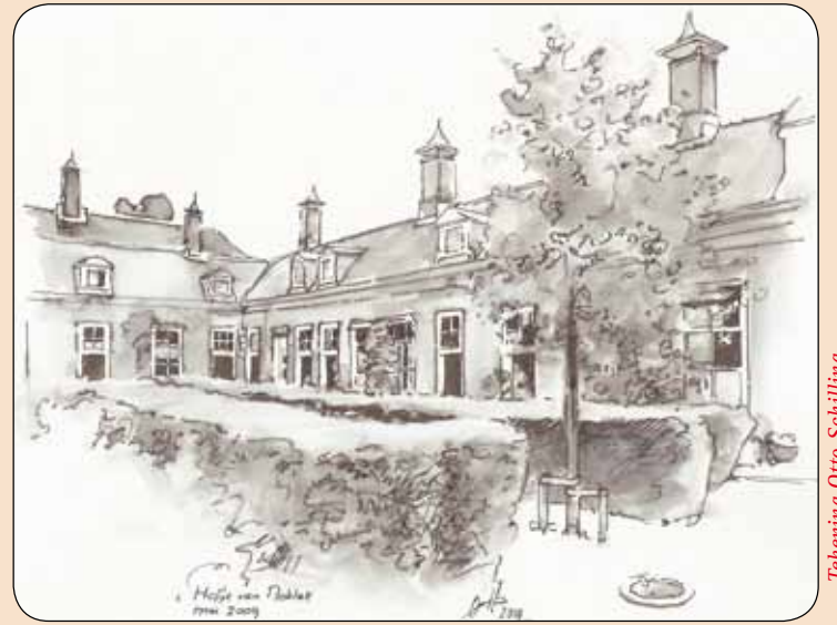
Tekening Otto Schilling

Toen het af was, zag ze zichzelf er eerst niet in. Maar de volgende dag zei ze: Ik ben het. De tweede dag heb ik haar in het ochtendlicht in profiel getekend. Pas in de derde tekening zijn haar ogen echt zichtbaar. Ze zit daar in het aureool van middaglicht”.