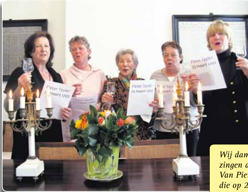
• Bewoonsters Wijnbergshofje zingen verjaardagslied

Voordat de dames eind maart 2009 voor een klassiek concert naar 't Mosterdzaadje vertrokken, werd die traditie nieuw leven ingeblazen. Als dank aan de gulle gever.