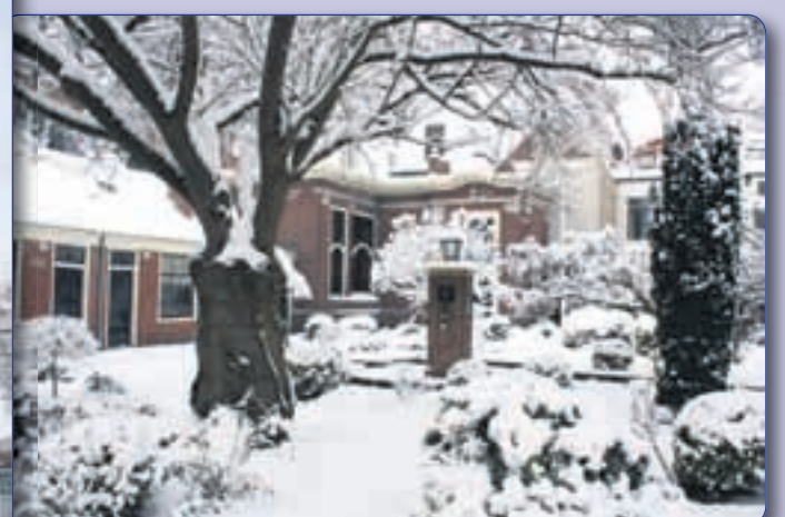
• LUTHERSE HOEJE