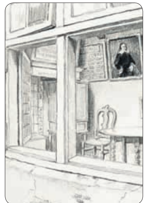
• Blik op interieur van het Broodhuisje getekend door H.J. Wesseling (1928)

heette ook de schuilkerk) of Bloemerts-hofje. Het lag aan de Biggsteeg (nu Bloemertstraat). Bloemert liet in 1659 geld na om zijn hofje te verbouwen. Er moesten 12 'camers' komen, een gemeenschapsruimte, een keuken en een regentenkamer. Over het hofje is verder vrijwel niets bekend. Het werd in 1774 wegens bouwvalligheid gesloopt.