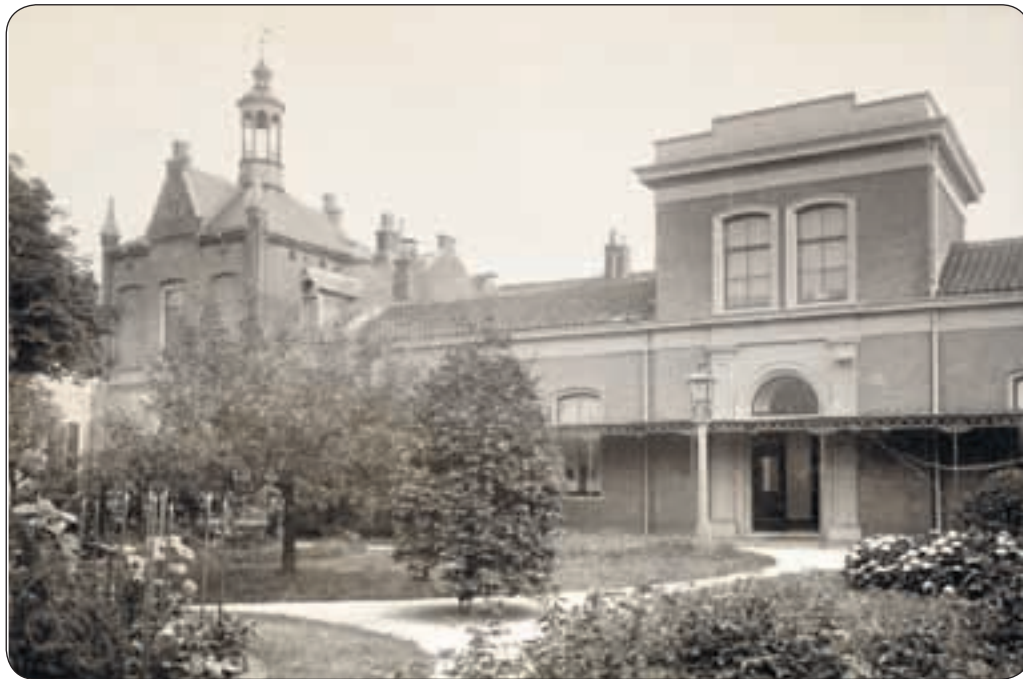
• Twee verdwenen katholieke hofjes, gelegen aan de Lange Herenstraat in het stationsgebied. Foto 1904. Rechts het Hofje van Codde, gebouwd 1872. Daarnaast het Hofje Van Beresteyn, gebouwd in 1688 en in neo-Romaanse stijl herbouwd in 1885. Beide hofjes werden in het kader van de stations-plannen in 1969 gesloopt, samengevoegd en herbouwd aan de Jos. Cuyperstraat aan de voet van de Kathedrale Basiliek Sint-Bavo.

De katholieke hofjes zijn niet zomaar gesticht, schrijft Cerutti. Na de reformatie werd het de katholieken vrijwel onmogelijk gemaakt om de zorg voor hun armen goed te organiseren. Een manier om belemmeringen, opgelegd door het stadsbestuur, te omzeilen, was door het stichten van een hofje en het bestuur te leggen in handen van regenten die ook