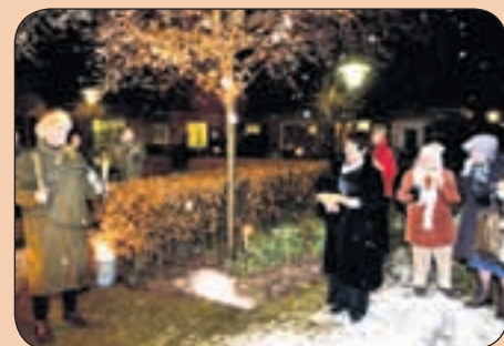
• Jachthoornblazers in het hofje van Codde en Van Beresteyn